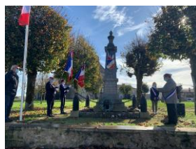
Cérémonie du 11 novembre 2020

Malgré une année 2020 compliquée et une rentrée des classes pas facile, la nouvelle équipe Municipale travaille dans le même sens sur la défense incendie, la communication, les travaux de voirie, la réfection des bâtiments, les plannings des employés et les mises aux normes, toujours changeantes.